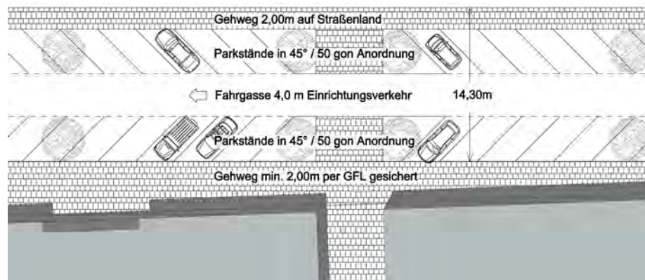
Systemskizze Aufteilung Scharnstraße

Die Scharnstraße soll im Zuge der Entwicklung des Plangebietes umgebaut werden, vorgesehen ist hier ein Einrichtungsverkehr in Ost-West-Richtung (von der Friedrichstraße zur Straßen des Friedens) sowie der Einbau von beidseitigen Stellplätzen in Schrägaufstellung (45° / 50 gon), die durch Baumpflanzungen gegliedert werden sollen. Mittig ist eine Fahrgasse mit einer Breite von 4,0 m vorgesehen. Damit ist die Unterbringung von rd. 50 öffentlichen Stellplätzen Straßenraum möglich.