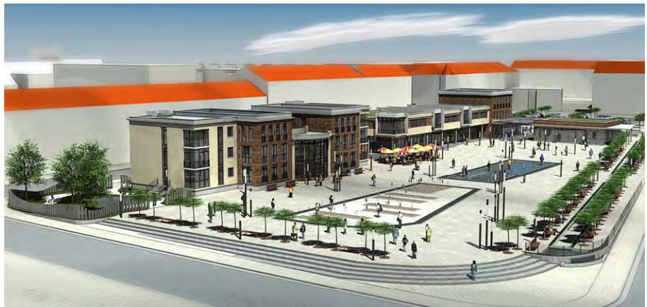
Städtebauliches Konzept, Blick von Südwesten

Die geplante Bebauung soll ein breites Spektrum unterschiedlicher Nutzungsmöglichkeiten eröffnen. Dabei sind in den Erdgeschosszonen vorwiegend öffentliche Nutzungen wie kulturelle - und Serviceeinrichtungen, Gastronomie und kleinteiliger Einzelhandel vorgesehen. In den Obergeschossen entlang der Scharrstraße sind vorwiegend betreute Seniorenwohnungen sowie entsprechende Versorgungs- und Serviceangebote geplant.