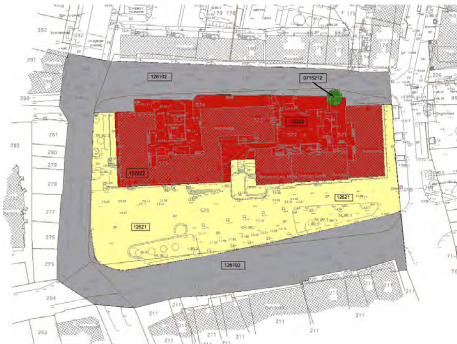
Abb.2: Biotoptypen des Plangebietes (unmaßstäblich)

Nach dem Abriss der Wohnblöcke auf den Flurstücken 521, 524 und 525 sind lediglich Reste von Straßen begleitendem Abstandsgrün sowie die o.g. 3 Bäume mit Stammumfängen über 60 cm auf den ehemaligen Wohngrundstücken erhalten. Auf den offenen Flächen haben sich zwischenzeitlich mehrjährige ruderale Staudenfluren so genannter Allerweltsarten angesiedelt. Auf der ehemaligen Platzfläche wurden durch engagierte Bürger „Themenbeete“ angelegt, die überwiegend mit Sommerblumen oder mehrjährigen Blumenstauden z.B. in Form des Stadtwappens bepflanzt sind.