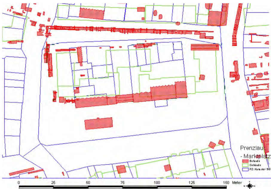
Abb. 4: archäologische Befunde rot (alle Zeiten) auf Kataster von 1957

Das im 2. Weltkrieg zerstörte Rathaus sowie die benachbarte Wache wurden einschließlich der angrenzenden Gebäude Anfang der 1960er Jahre abgerissen. Auf dem Marktberg entstand ein Platz für Großkundengebungen. Durch die folgende städtebauliche Entwicklung in der Umgebung wurde die Platzfläche des Marktberges nach Westen und Osten aufgeweitet. In den 1980er Jahren wurden auf dem nördlichen Teil des Marktberges Wohnblöcke in Plattenbauweise errichtet. Die Bebauung orientierte sich mit ihrer südlichen Kante an der Bauflucht des barocken Rathauses und der ehemaligen Hauptwache. 2007 wurden die Plattenbauten des Typs WBS 70 bis auf ein Gebäude abgerissen. Seit 2009 wird der Marktberg teilweise temporär begrünt.