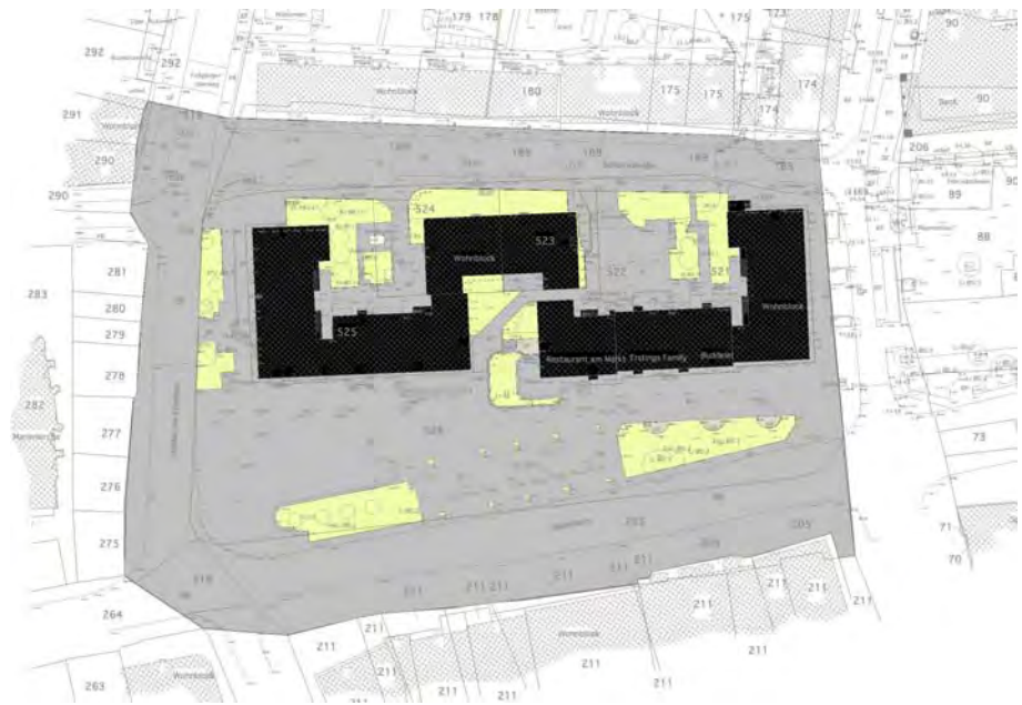
Abb.2: Versiegelung des Plangebietes Stand 2007 (unmaßstäblich)

Positive Auswirkungen für das Standortklima haben die strassenseitig angeordneten Großbaumpflanzungen (Linden) sowie (ehemals) die mit Sträuchern bestandenen Grünflächen entlang der Scharnstraße sowie den Innenhöfen der Wohnblöcke.