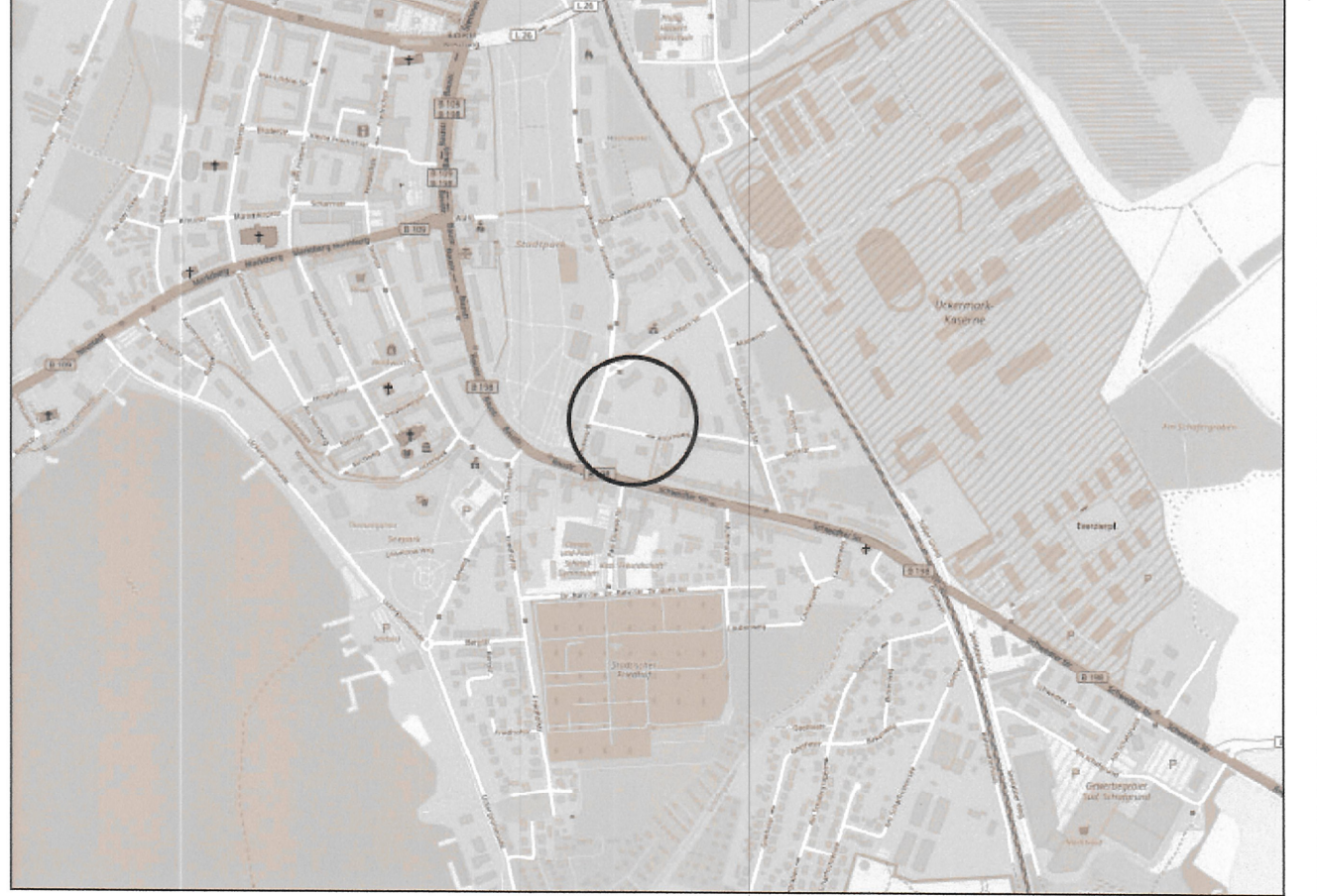
Übersichtsplan zum vorhabenbezogenen Bebauungsplan "Wohnungsbau Grabowstraße 4"

Vorhabenbezogener Bebauungsplan "Wohnungsbau Grabowstraße 4" Stadt Prenzlau Satzung Stand 11.03.2019